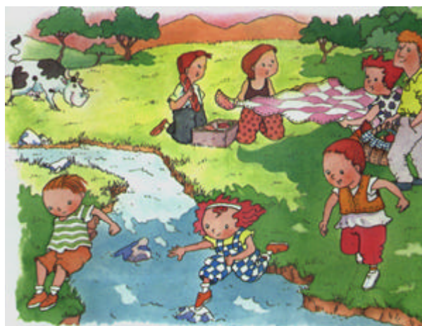
Dibujo tomado del cuaderno de vacaciones de Editorial Edebé

Inventa un cuento a partir del dibujo. Ponle un título y escribe un final.